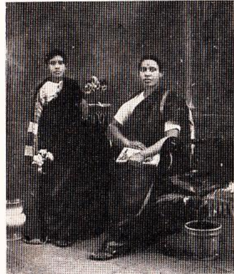
... आणि हे रूप